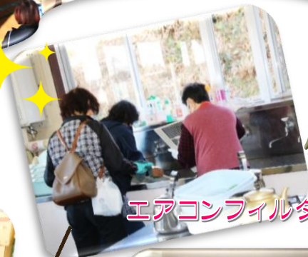
エアコンフィルター掃除