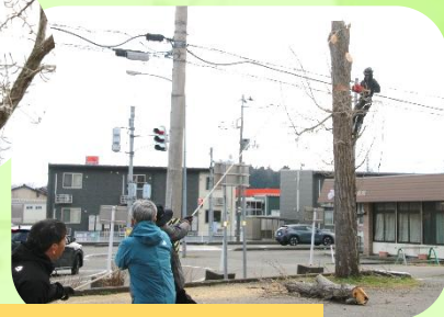
ロープをかけて、せーのっ！