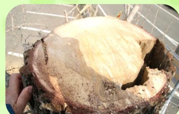
上部の切断面 雷が原因？穴が空いている！